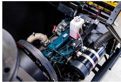
Облегченный доступ к двигателю