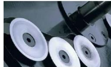
Запатентованные дискообразные ножи